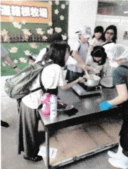
【キャラメル作りを楽しむ】