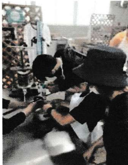
【ソーセージ作りに悪戦苦闘】