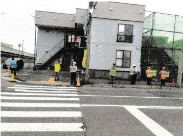
【早朝からの街頭啓発の様子】