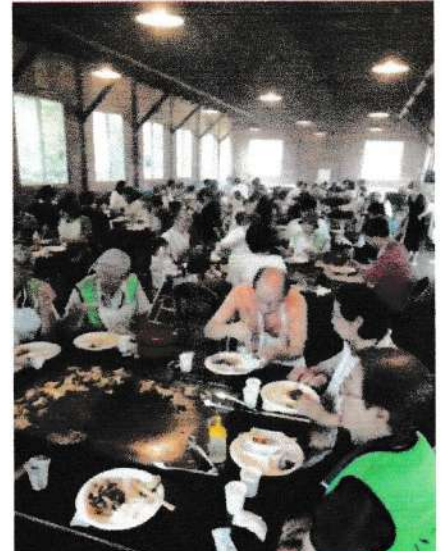
【みんなでワイワイ食事会】