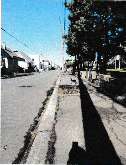
【路上の街路樹伐採後】