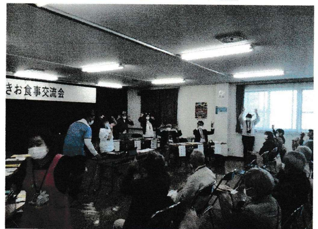
【運動を兼ねたキツネダンスを全員で行う】

◎約100人の出席者のもと、健康講和や体操の実施 手稲警察署による特殊詐欺の現状と対策等を、ビデオで実例を見ながら、勉強しました。